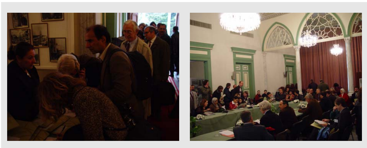
Ankunft der Teilnehmer im Tagungsraum Tripoli