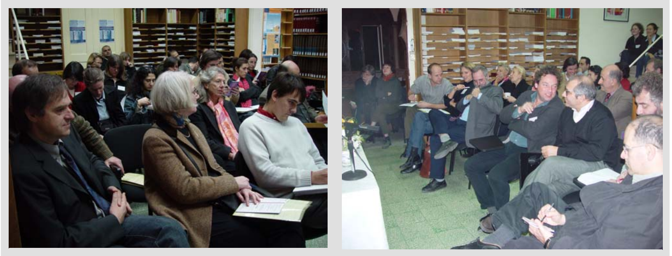
Teilnehmer am OIB vormittags und abends