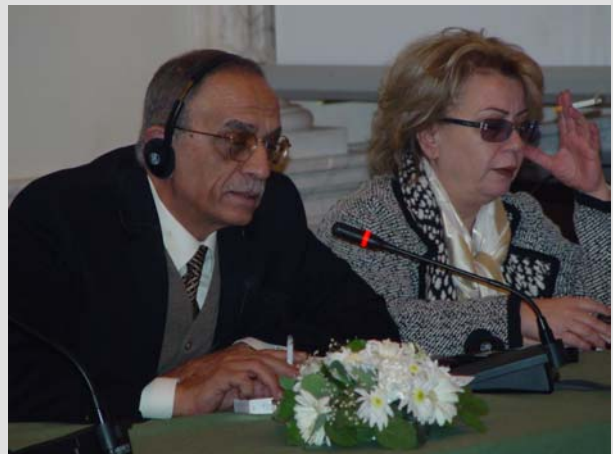
Der Bürgermeister von Tripoli und seine Frau - zwei Tage interessierte Zuhörer