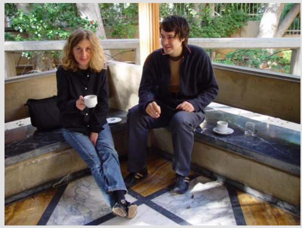
Pause während des Workshops: Meister, Sassmannshausen